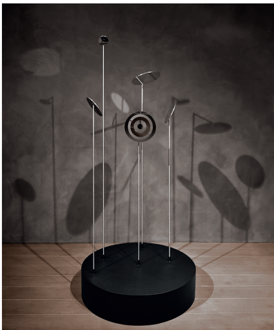
Satyre, 2016, mirror polished, steel