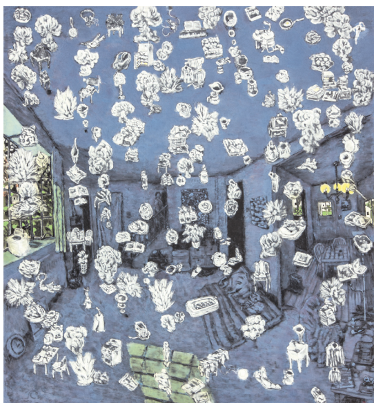
YOO Geun-Taek, The room , 2011 Black ink and white powder on Korean paper 149 x 138 cm

Enfin, et pas des moindres, SHIN Meekyoung (1967) réalise une panoplie de vases classiques chinois — en savon — reproduisant fidèlement les effets de la porcelaine et de la transparence de l'agate et d'autres matériaux translucides.