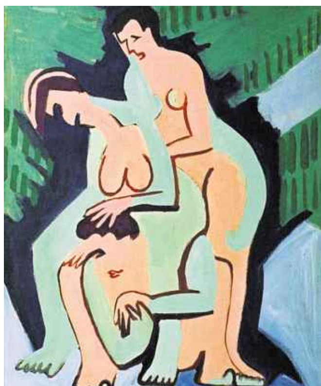
Reflex auf die Lebensreform. 1928 malte Ernst Ludwig Kirchner seine „Spielenden Badenden“ in sattgrüner Natur.

— Artvera's, 1 rue Étienne-Dumont, Genf; bis 30.7., www.artveras.ch