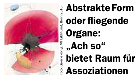
Abstrakte Form oder fliegende Organe: „Ach so“ bietet Raum für Assoziationen