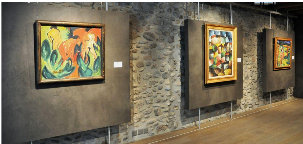
Monte Verità – paysage et mythe alpin, salle 1.

Actualmente se expone en la Galería Artveras de Ginebra la exhibición “Monte Verità: Expressionist Utopia”, una muestra que refleja el estilo de vida de la legendaria Colina de la verdad