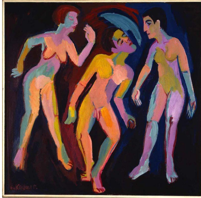
Ernst Ludwig Kirchner (1880–1938), Tanz zwischen den Frauen II , 1919–1926, oil on canvas, 150 x 150 cm 59.05 x 59.05. Foto: Artveras Gallery

En la gala de inauguración se pudo apreciar una selección del trabajo de artistas rusos y europeos de vanguardia que incluyó a Marianne von Werefkin, Alexej von Jawlensky, Ernst Ludwig Kirchner y Arthur Segal. Esta es la primera exposición monográfica que se enfoca en la herencia del peculiar estilo de vida del Monte Verità en la iconográfica propuesta de los artistas europeos de las primeras décadas del siglo XX.