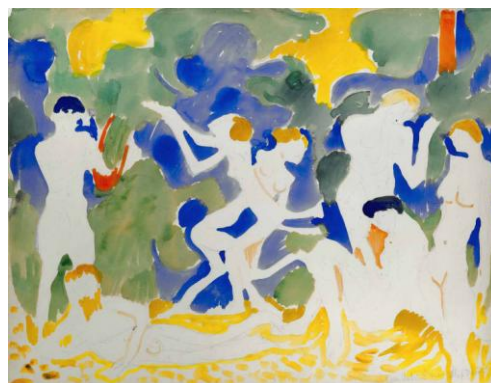
André Derain, La Musique , ca. 1904-1905