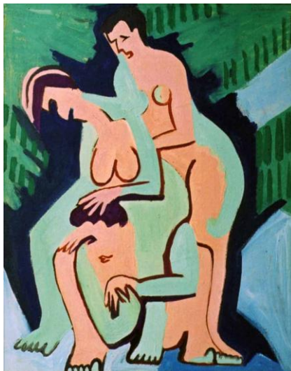
Ernst Ludwig Kirchner, Spielende Badende, 1928