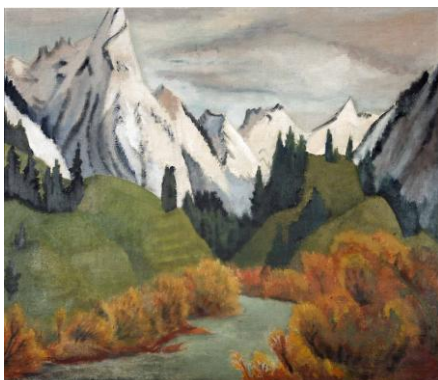
Erich Heckel, Fluss im Gebirge , 1923

Выставка «Monte Verità – экспрессионистская утопия» раскрывает легенду альпийской Швейцарии в XIX веке, куда со времен эпохи Возрождения приезжали с туристической миссией молодые аристократы, чтобы дополнить свое образование опытом восприятия мира «на месте» и «воочию». Швейцария со всей своей необыкновенной природой, захватывающими дух пейзажами, целебной силой горного воздуха стала местом, куда многие художники отправлялись в поисках альтернативной жизненной идиллии. На рубеже XIX века Monte Verità стала убежищем для многих творцов, искавших спасения от социальных и политических ограничений, творческой свободы, природного вдохновения и внутреннего обновления.